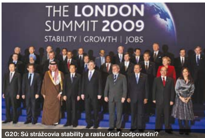
G20: Sú strážcovia stability a rastu dosť zodpovední?

Zostáva teda centrálna otázka dôvery v systém, ktorá bola silno poškodená a jej obnovenie si vyžiada čas. Vo väčšine krajín v súčasnom čase prevažuje názor, že finančný systém nepekne zlyhal, ale že stimuly a dynamika širšieho trhového systému v relatívne otvorenej globálnej architektúre zostávajú najlepšou cestou k tvorbe bohatstva, znižovaniu chudoby a rozširovaniu príležitostí.