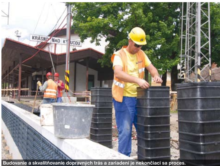
Budovanie a skvalitňovanie dopravných trás a zariadení je nekončiaci sa proces.

- Mali sme štyri základné problémy. Ten prvý bola cena, druhý bol tzv. underpinning, tretí refinancovanie a štvrtý – zmena zákona o verejnom obstarávaní. Zmenu zákona sme v parlamente schválili a už nadobudla účinnosť. Pri refinancovaní sme sa s víťazným konzorciom dohodli, že prvé bude vo výške 100 % percent v prospech štátu. Underpinning je vyriešený, zostáva cena. Underpinning – čiže ručenie voči financujúcim bankám z úrovne štátu v prípade defaultu dodávateľskej časti konzorcia - predstavoval veľký zlatý dáždňik pre banky, ktoré sa podieľajú na financovaní tohto projektu. Fakt je, že situácia je neštandardná a ak sa chceme pohnúť dopredu, musíme prijímať aj neštandardné riešenia. Ale postup bánk v prípade underpinningu znamenal, že sa tento projekt preklopí z PPP projektu do projektu bežného financovania. Potom stráca význam PPP projekt a stráca sa aj jedna z jeho podstatných častí benefitov a to je skutočnosť, že sa nepočíta do verejného dlhu. Postupne