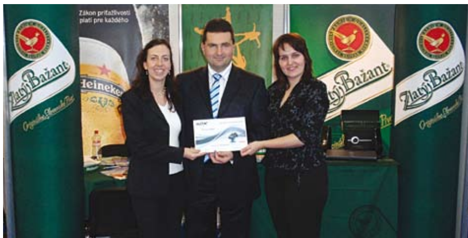
Firmy si manažérov aj vychovávajú. V rámci programu Management Trainee koncernu Heineken prechádzajú absolventi rôznymi oddeleniami, kde potom môžu získať pozíciu. Spoločnosť ich prijíma aj do dvojročného programu International Graduates.

mal dostatočnú možnosť na tvorivosť pri dodržaní štandardov, potrebných pre kvalitný výstup. Tento nástroj dáva pracovníkovi istotu v spôsobe vykonávania jeho práce. Definuje statické veci, ako sú účel, vlastnosti, miesto v štruktúre, predpoklady a zodpovednosť, rovnako ako dynamické veci, ako sú smernice, technologické postupy, komunikačné