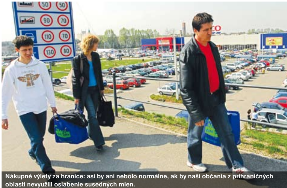
Nákupné výlety za hranice: asi by ani nebolo normálne, ak by naši občania z prihraničných oblastí nevyužili oslabenie susedných mien.