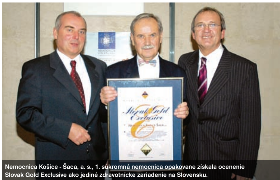
Nemocnica Košice - Šaca, a. s., 1. súkromná nemocnica opakovane získala ocenenie Slovak Gold Exclusive ako jediné zdravotnícke zariadenie na Slovensku.