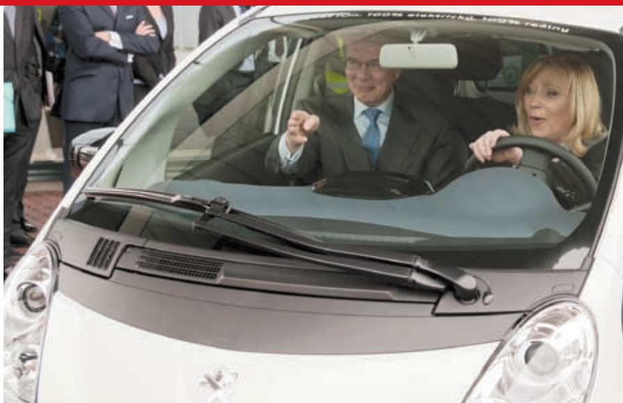
Premiérka Iveta Radičová a Philippe Varin v Peugeot iON.