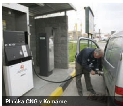
Plnička CNG v Komárne

Stlačený zemný plyn CNG si popri LPG (Liquified Petroleum Gas) získava čoraz viac priaznivcov v celej Európe. Pri spaľovaní CNG uniká do ovzdušia nižšie množstvo emisií CO 2 než pri klasických motorových palivách. Intenzívnejšie využívanie CNG podporuje Európska únia, ktorá v roku 2001 prijala tzv. Bielu knihu o spoločnej