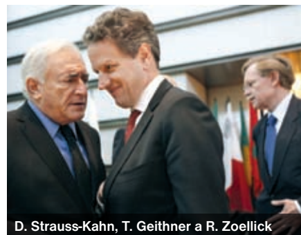
D. Strauss-Kahn, T. Geithner a R. Zoellick

Mnohí ministri vyčítali USA vysoký rozpočtový schodok a ich kvantitatívny program uvoľňovania menovej politiky, v rámci ktorého centrálna banka nakupuje štátne dlhopisy a pumpuje tak do ekonomiky peniaze. Šéfa MMF Dominiqua Straussa-Kahna (na foto s ministrom financií USA Timothy Geithnerom a prezidentom SB Robertom Zoellickom) znepokojuje aj pomalé vytváranie pracovných