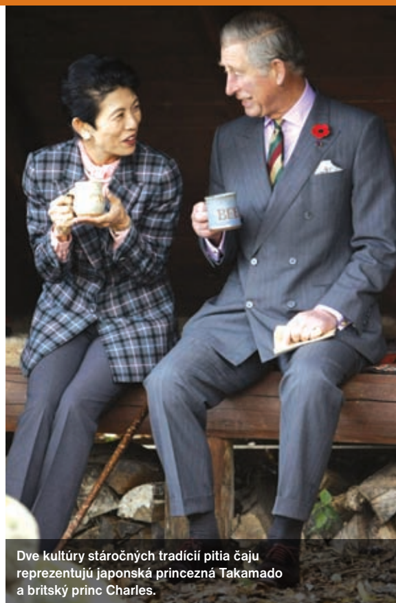
Dve kultúry stáročných tradícií pitia čaju reprezentujú japonská princezná Takamado a britský princ Charles.

Medzistupeň medzi zeleným a čiernym čajom tvoria polofermentované čaje, tzv. oolongy, ktoré zväčša mávajú – vďaka