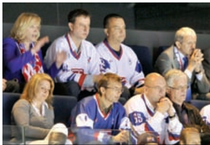
Prostredie pre biznis na Slovensku? Top 15? Je to v rukách tejto partie. (Vraj sme už lepší ako Slovinsko.)

Najneskôr do roku 2020 by sa malo Slovensko umiestniť v prvej pätnástke rebríčka Svetovej banky Doing Business. Túto ambíciu si kladie vláda SR v rámci Národného programu reforiem. V súčasnosti sa SR nachádza na 41. priečke.