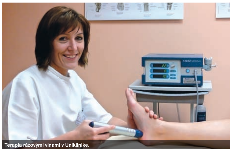
Terapia rázovými vlnami v Uniklinike.

Nadštandardné preventívne prehliadky v Uniklinike kardinála Korca v Prievidzi, rovnako ako aj v Diagnostickom centre Nemocnice Košice-Šaca – to je komplex vyšetrení u lekárov špecialistov so zameraním najmä na včasnú diagnostiku srdcovocievnych, onkologických a tzv. civilizačných ochorení. Včasná diagnostika znamená veľký a nezaplátiteľný prínos pre