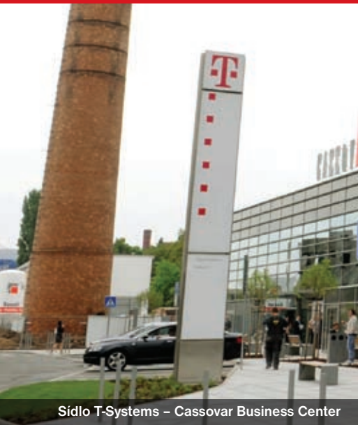
Sídlo T-Systems – Cassovar Business Center