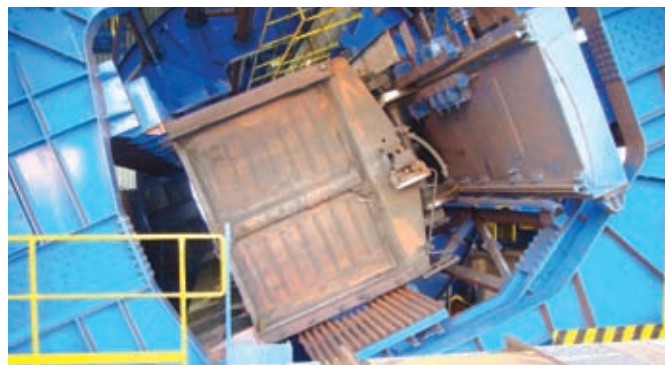
Modern technology of rotary tipper for bulk substrates enables to tilt the broad-gauge wagons by 180°.

Besides the point of contact of broad-gauge rails with normal-gauge rails, it is also necessary to take into consideration two different transport laws – SMGS and CIM, which our company ensures through new registration and the common consignment note SMGS/CIM. In connection with different railway gauges, ZSSK CARGO has built up complex of facilities, which enable the transshipment of goods and bogie change. However, the workplaces of Eastern Slovak Transshipment Yards – ESTY – ensure also other operations, which are related to, for example, thawing of bulk substrates in winter period, customs services including customs warehouses and necessary documentation, weighting of goods or arrangement of transport documentation on behalf of customer. Our aim is not only to transship the goods, but also to provide complex, fast and high-quality service.