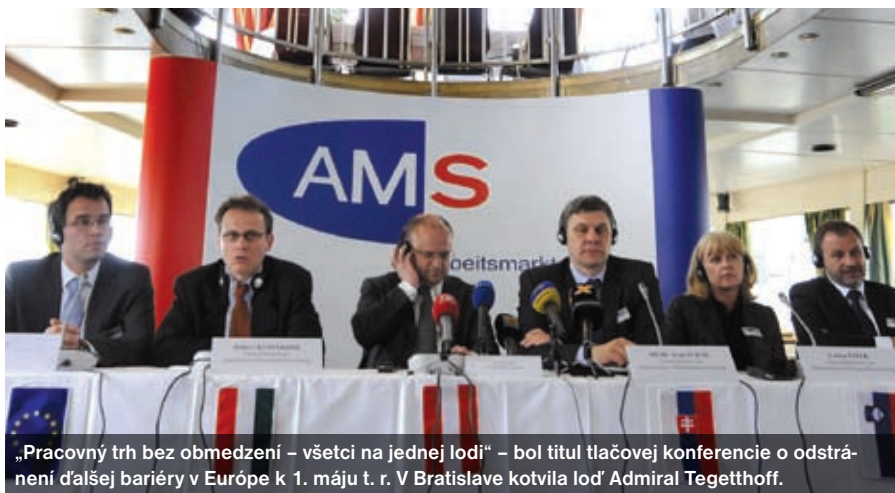
„Pracovný trh bez obmedzení – všetci na jednej lodi“ – bol titul tlačovej konferencie o odstránení ďalšej bariéry v Európe k 1. máju t. r. V Bratislave kotvila loď Admiral Tegetthoff.

© Project Syndicate Krátené; titulok a medzititulky redakcia