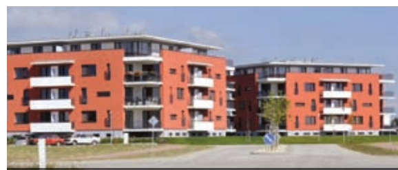
Prvá Penzijná spravuje aj veľmi úspešný realitný fond

„Výborné čísla, či už v podobe nárastu objemu majetku pod našou správou, nárastu počtu klientov a takmer dvojnásobného nárastu zisku,