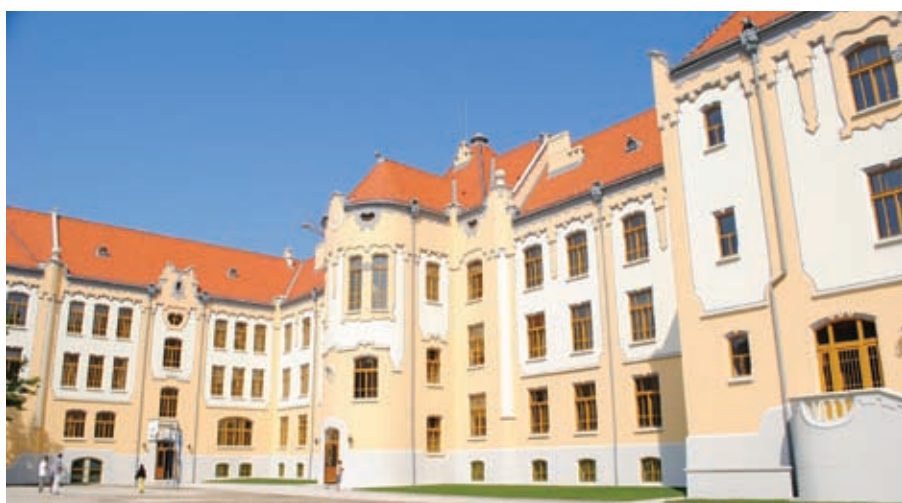
Zrekonštruovaná historická budova na Grösslingovej ulici v Bratislave, kde sídli jedno z osemročných gymnázií patriacich do pôsobnosti BSK.